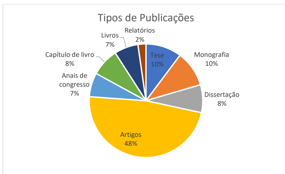
Figura 1: tipo de publicações

Do conjunto dos recursos metodológicos de busca resultaram 90 textos 3 , compostos por teses, dissertações, trabalho de conclusão de curso ou monografias e artigos, como mostra a figura 1.